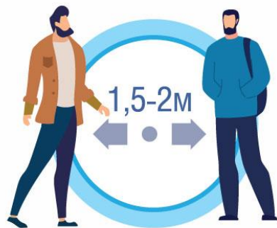
СОБЛЮДАЙТЕ РАССТОЯНИЕ И ЭТИКЕТ