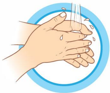
ЧАСТО МОЙТЕ РУКИ С МЫЛОМ